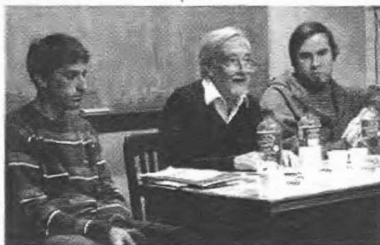
Periodistas de Olé y La Nación