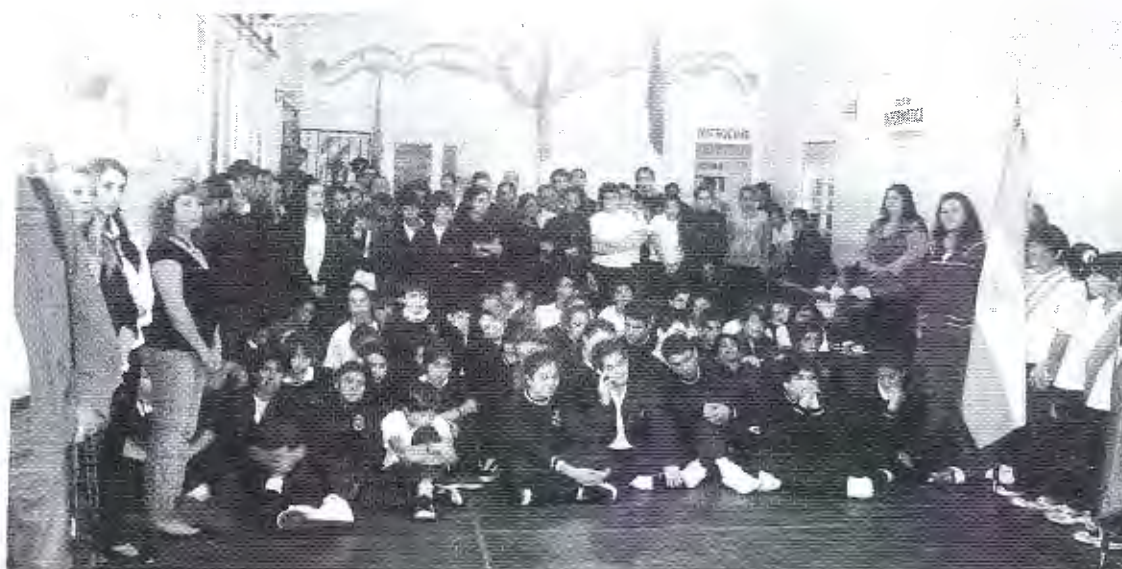
Colegio Colinas de Mar del Plata. Presentación del programa "Formando espectadores responsable"