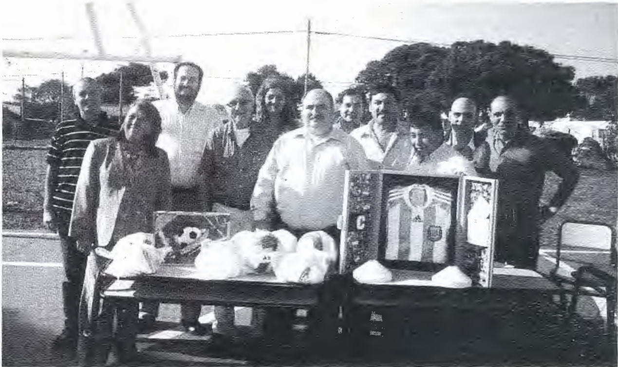
Autoridades educativas de la Escuela Secundaria N°3 de Mar del Plata y representantes institucionales

campeonato de Paraná Campaña viven situaciones de violencia y es nuestro deber como dirigentes promover acciones de preventivas con los chicos de fútbol que además de jugar, asisten a ver los partidos de los adultos”.