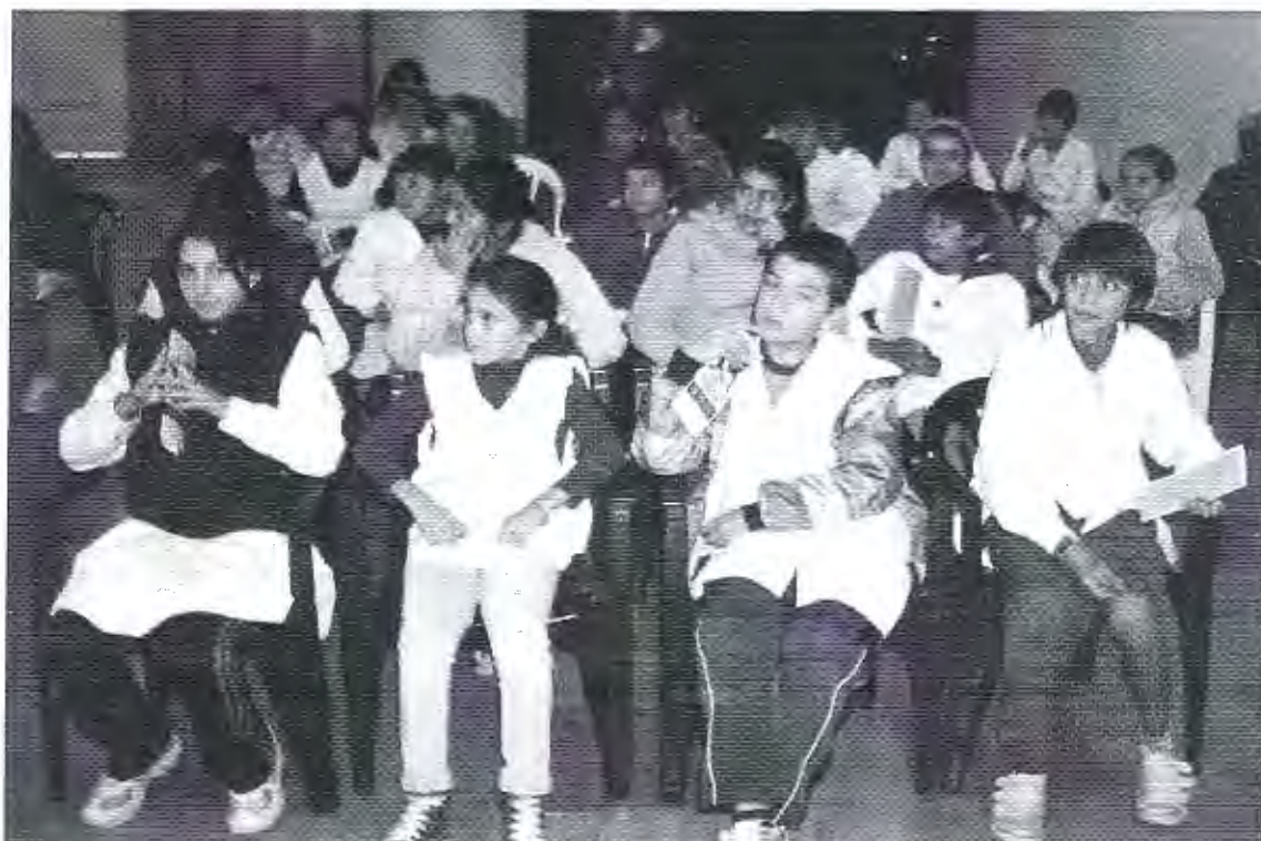
Taller. Trabajo con alumnos de 7º grado en Hernandarias Entre Ríos