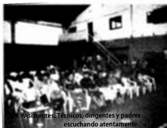
Asistentes. Técnicos, dirigentes y padres escuchando atentamente.